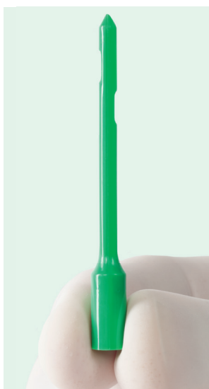
Cannuccia di mungitura STERIL .