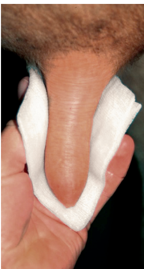
Zitze reinigen und desinfizieren.

Querengässer und Geishauser 2001: Prakt. Tierarzt 82, 527–534.