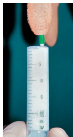
Introduire le médicament.

STERIL . Vider le lait et introduire des médicaments.